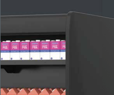
Detalle lateral superior Upper end panel detail