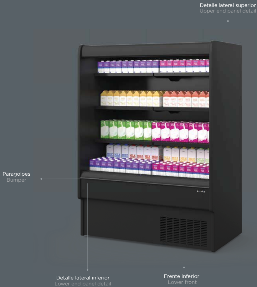
Detalle lateral superior Upper end panel detail