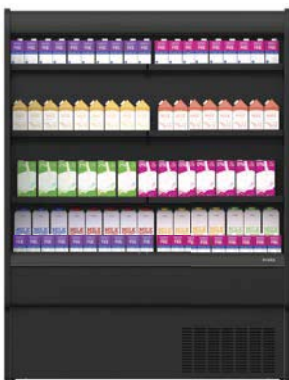
Merac Narrow MN1 Plug in frontal Frontal Merac MN1 Narrow Plug in