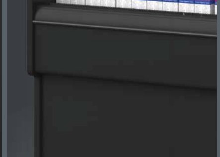
Detalle lateral inferior Lower end panel detail