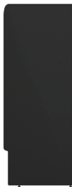
Merac Narrow Plug in MN1 lateral Lateral Merac Narrow MN1 Plug in