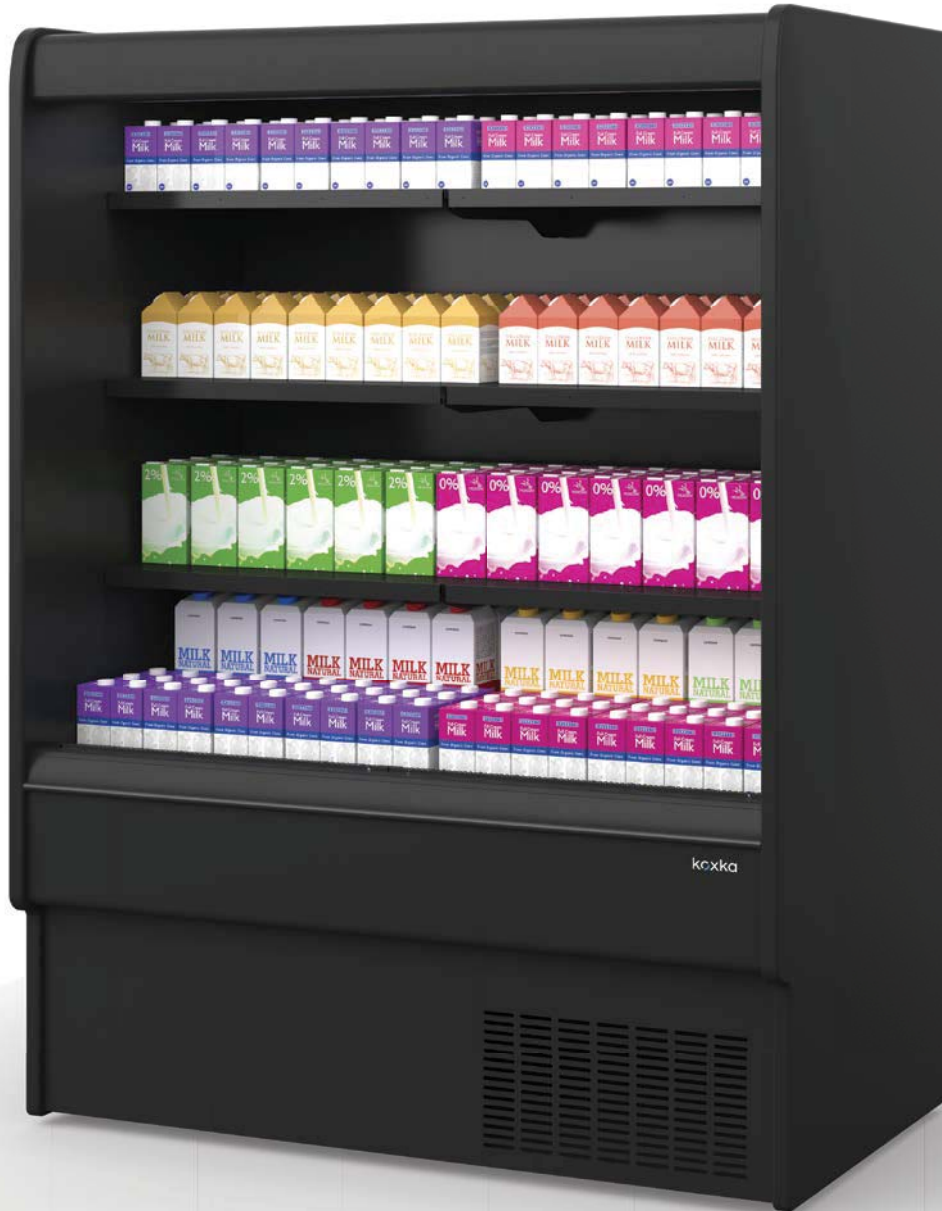
Merac Narrow MN1 Plug in Merac Narrow MN1 Plug in