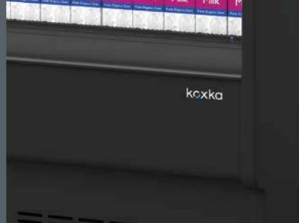
Frente inferior Lower front